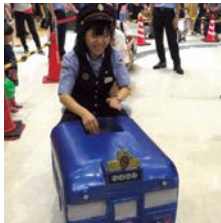
※画像は昨年イベントの様子です。