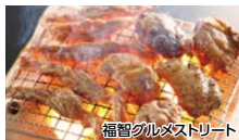
福智グルメストリート