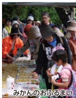
みかんのおふるまい