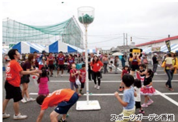
スポーツガーデン香椎

名島城址や神社の歴史を巡り、自然豊かな公園やあいたか橋を遊歩していただけるコースです。ゴールした後にはボーリングでもう一汗かいたり、温泉で汗を流したりとお楽しみいただけます。(温泉は14:00まで)