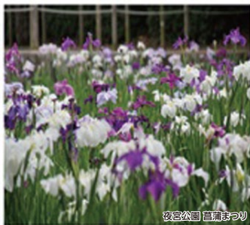
夜宮公園 菖蒲まつり

戸畑の「産業遺産」に歴史を感じ、コース後半の「とばた菖蒲まつり」では50種2万本の花菖蒲に癒され、「若戸大橋」を眺めながらゴールの戸畑駅を目指します。