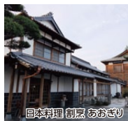
日本料理 割烹 あおぎり