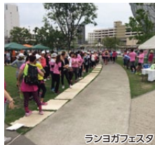
ランヨガフェスタ