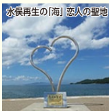
水俣再生の「海」恋人の聖地

水俣ローズフェスタ 750種6,500株のバラが咲くエコパーク水俣バラ園、バラの壁やつるバラのトンネルなど、香りと豪華さは圧巻です。