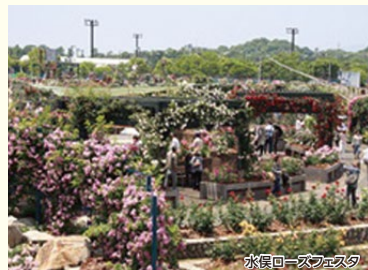
水俣ローズフェスタ

道の駅で開催中の「水俣ローズフェスタ」に合わせ、水俣の文化人「徳富蘇峰・蘆花や村下孝蔵」の足跡を巡り、水俣スイーツを味わい、水俣の歴史を忘れることなく、再生した不知火海と満開のバラを満喫するコース。