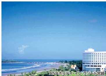
ANAホリデイ・イン リゾート宮崎

宮崎のシンボル「青島」まで歩きます。太平洋を望みながら、海岸沿いで南国の風を感じてみてはいかがでしょうか?ウォーキングの後は、展望温泉をお楽しみください。