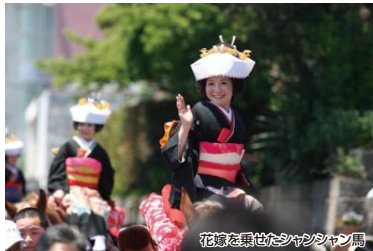
花嫁を乗せたシャンシャン馬

鹿児島県下三大祭りの一つである志布志お釈迦まつりや伝統のある大慈寺、宝満寺等を巡りながら散策し、歴史を感じることが出来るコースです!また、イベントやパレード・踊り連・花嫁を乗せたシャンシャン馬は必見です!