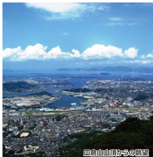
皿倉山山頂からの眺望

ケーブルカーとスロープカーを利用して山麓駅から皿倉山山頂まで行くことができます。また、舗装道を歩けば、新緑の皿倉山を楽しむことができます。