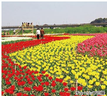
チューリップ広場

遠賀川河川敷で開催される、のおがたチューリップフェアで、咲き乱れるチューリップを満喫していただいた後は、直方レトロ街をゆっくりご覧ください。