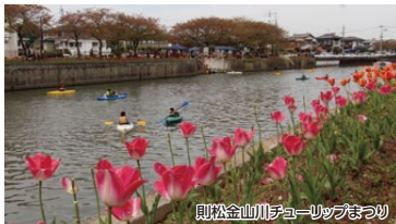
則松金山川チューリップまつり

瀬板の森公園で自然を体感していただき、金山川遊歩道に咲いている色とりどりのチューリップを満喫していただけるコースです!!