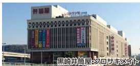
黒崎井筒屋・クロサキメイト

お花見しながら芸能・音楽を楽しめます。 模擬店やイベントも盛りだくさんです。 笑顔満開!! 楽しさ満祭!! 城山でお花見を十倍楽しもう。