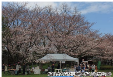
城山さくら祭り会場(城山緑地公園)

旧長崎街道を歩き、コース途中の城山緑地公園では満開のさくらを見ながら「城山さくら祭り」を楽しむことができます。