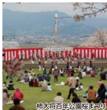
柿大将百年公園桜まつり