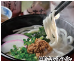
佐伯ごまだしうどん

戦争遺跡や城下町佐伯の「歴史と文学のみち」を散策し、全国的にも人気を博している佐伯のご当地グルメ「ごまだしうどん」を食べ歩き。佐伯の歴史に触れ、心も体もポッカポカ!