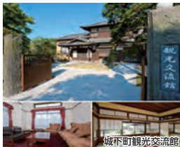
城下町観光交流館