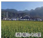
(有)福ふくの里 福吉牡蠣小屋4店舗 (エリア)

JR福吉駅から歩いて10分の福吉牡蠣小屋。牡蠣、サザエ、ハマグリ、車海老など地元産ばかりです!