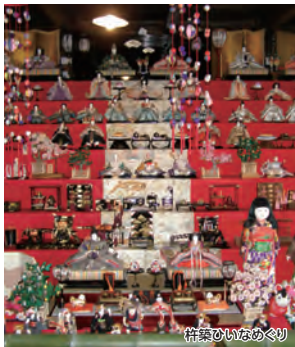
杵築ひいなめぐり

雛を「ひいな」と古語で言い表す杵築で、松平家ゆかりの雛や佐野家・後藤家などの名家が所有する雛が多数展示され、江戸の風情が残るサンドイッチ型城下町杵築を散策してお楽しみください。