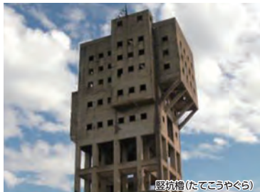
堅坑櫓(たてこうやぐら)

現在世界で、3つしか残っていないといわれる、貴重な堅坑櫓を眺め、通常見ることができない堅坑櫓で使用したプロペラ、岩崎神社の絵馬堂(通常時未開放)を見学できます。志免の炭鉱文化と歴史を堪能できるコースです。