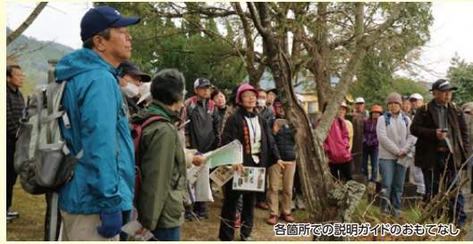
各箇所での説明ガイドのおもてなし

来年のNHK大河ドラマ「西郷どん」ゆかりの地である国指定史跡「西南戦争遺跡」を散策。木葉猿黛元見学と、地元特産品を満喫できる「ふれあいの丘交流祭」イベントに参加するコースです。