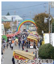
まるごとみやま秋穫祭