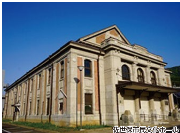
佐世保市民文化ホール

佐世保駅周辺には、とんねる横丁(日本遺産)をはじめ、佐世保市民文化ホール(国の有形文化財)など歴史的建造物があり、佐世保の歴史も学べるコースです。