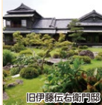
旧伊藤伝右衛門邸