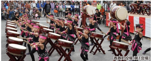
香春町役場(第1会場)

「ふるさと香春秋まつり」と「農業まつり」を開催いたします。まつりの会場を2箇所巡り、町中が賑やかな声にあふれ、ウォーキングする足も軽やかに運びごとうしょう。歴史あふれる香春町を、どうぞご堪能ください。