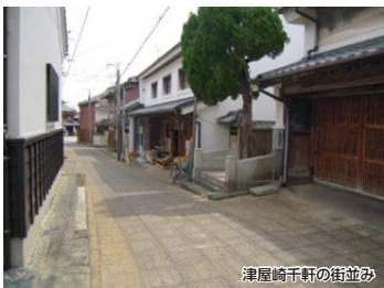
津屋崎千軒の街並み