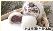
そば饅頭(布善本舗)