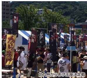
北九州からあげ王座決定戦

関門連絡船に乗って唐戸市場へ。新鮮な海の幸を堪能できます。関門トンネル人道をとり関門海峡を抜け、北九州からあげ王座決定戦会場へ。北九州の味自慢のからあげを楽しむことができます。