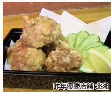
昨年優勝店舗 北組

北九州からあげ王座決定戦 中津のからあげに負けず劣らずの北九州の様々なからあげが集まり、三代目王座を競います。