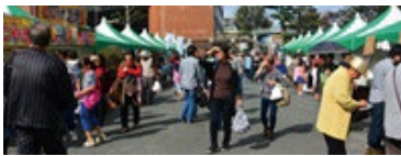
大野城市まちづくり産業展 毎年秋に開催される大野城市の一大イベント。自慢のグルメなども勢揃い。

大野城市内の有形民俗文化財で歴史を感じ、御笠川のリバーサイドウォークを楽しみます。その後、市内のグルメが集まる大野城市まちづくり産業展を巡るコースです。今回初登場の新規コースをお楽しみください。