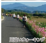
川沿いのウォーキング