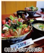
串間活メばりぶり丼ぶり

串間市民秋まつり メイン会場 祭りのメイン会場では、地場産品の販売や、多数のふるまいが行われています。ぜひお立ち寄りください。