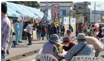
串間市民秋まつり

美味しい地場産物が並び、ふるまい多数の市民秋まつりのメイン会場や、国の重要文化財に指定されている旧吉松家住宅での催しもお楽しみください。コース中、川沿いのウォーキングも爽快ですよ!