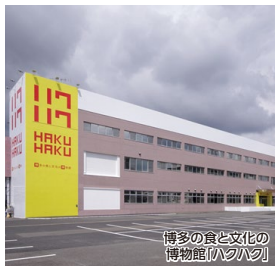
博多の食と文化の博物館「ハクハク」