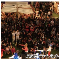
ハロウィンイベント

ウォーキング参加者限定で「夜の水族館」(※有料)をお楽しみいただけます。入館は18:00~19:30まで(閉館は20:30) ※イルカショー19:00~