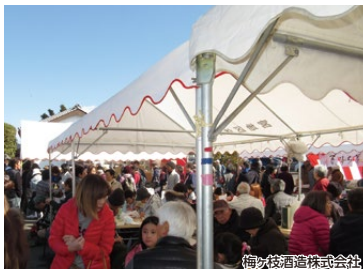
梅ヶ枝酒造株式会社

10月は毎年恒例の梅ヶ枝酒造蔵開きが開催され、芋焼酎の仕込み風景の見学や日本酒・リキュール・人気のあまざけなどの試飲販売、地元産品の即売会などが行われます。ぜひ、お越しください。