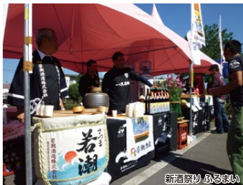
新酒祭り ふるまい

新酒のふるまいや志布志の特産品を味わっていただける新酒祭りと、潮風を感じながら、豊かな景観の志布志港を満喫できる、子どもから大人まで楽しめるコースです!!