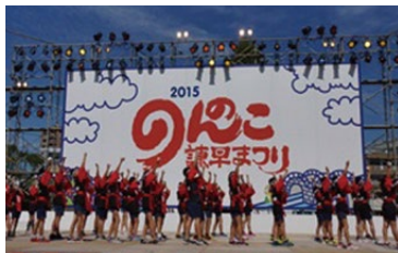
人気芸人がやってくる爆笑LIVEを開催! その他、ご当地ミュージックアワーやストリートダンスコンテストなど熱いパフォーマンスが繰り広げられます。熱気あふれる会場へぜひお越しください!!

諫早市の中心地を巡り、初秋の山、川等の自然を体感できるコースです。上山公園は急なアップダウンがありますが、木々に囲まれマイナスイオンを感じられます。