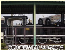
鳥栖市重要文化財 268号機関車