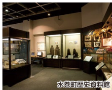
水巻町歴史資料館