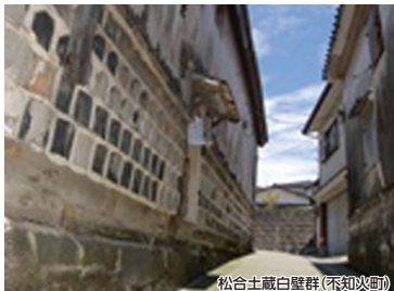
松合土蔵白壁群(不知火町)

干潟が広がる不知火海沿いを歩き、江戸時代から健在する土蔵白壁の町「松合」を訪ねます。江戸から明治にかけて漁業や醸造などで栄えた街並みで、当時の趣を感じます。