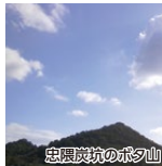
忠隈炭坑のボク山