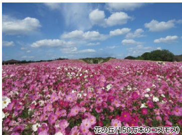
花の丘(150万本のコスモス)

海の中道海浜公園の無料開放デーに併せて園内を満喫できるコースです。自然あり! 動物いっぱい!ぜひ、ご家族でお楽しみください