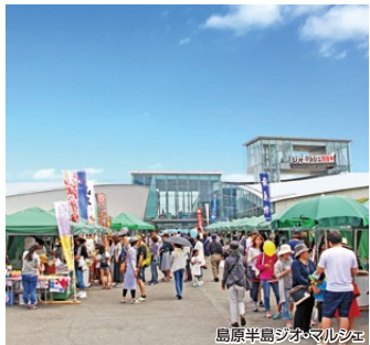
島原半島ジオ・マルシェ

雲仙普賢岳からの地下水が豊富に湧き出す湧水の街島原。街中の至るところに綺麗な水が流れています。また、ゴールである雲仙岳災害記念館の火山体験ミュージアムでは、島原半島の特産品を集めた島原半島ジオ・マルシェが開催されています。