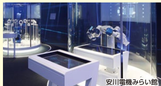
安川電機みらい館

安川電機みらい館と歴史館を、当日限定で一般公開します。(開館時間8:30~13:00) 産業用ロボットの最先端技術が作り出す、ものづくりの楽しさと凄さを体感することができます。