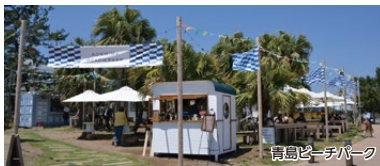
青島ビーチパーク

「鬼の洗濯板」とビーチの絶景の中でのウォーキング。願いが叶う3つの神事体験や、ヨガ、温泉、ビーチパークでのカフェタイムなど、青島の魅力が詰まったウォーキングコースです。