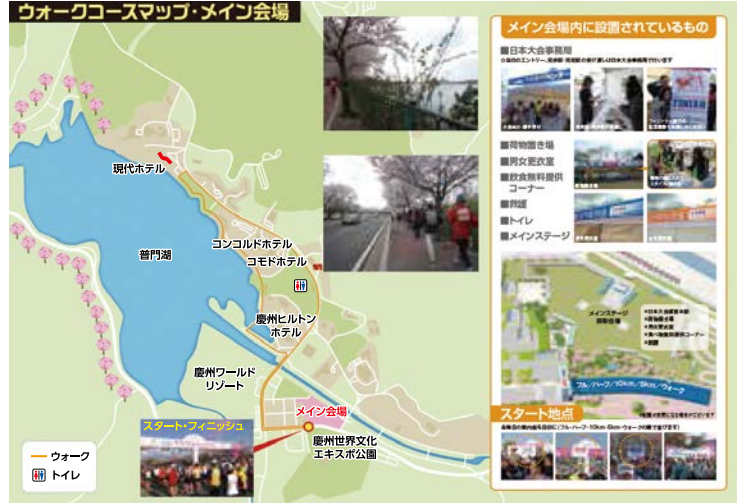
さくらウォークコースマップ