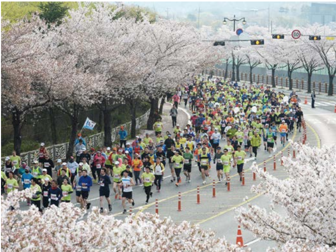
慶州さくらマラソン2018の様子